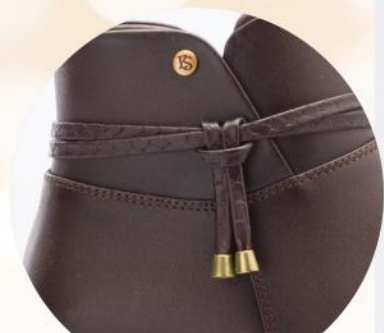
Detalle de calzado