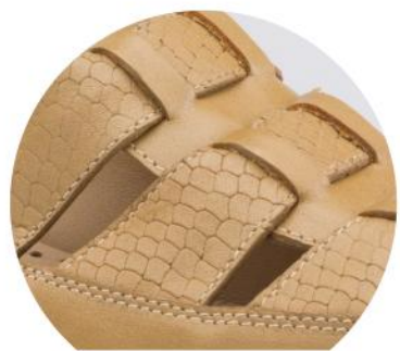
Detalle de calzado

Material: CUERO Planta: CAUCHO Horma: GRANDE Tallas: 35-39