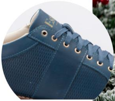
Detalle de calzado