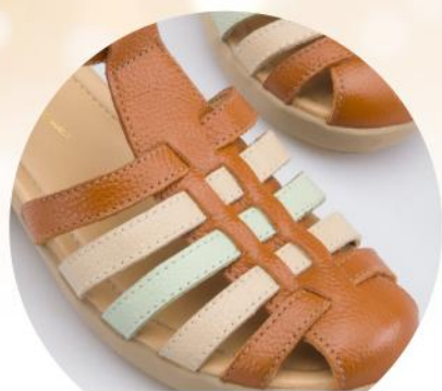
Detalle de calzado