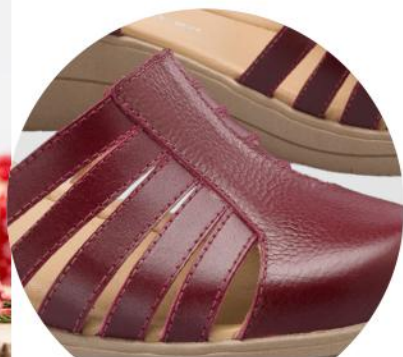
Detalle de calzado