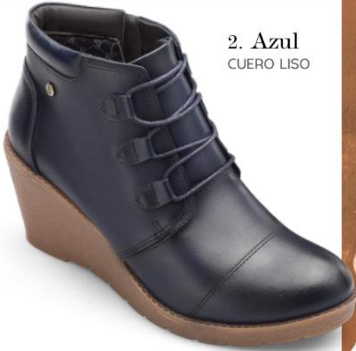
2. Azul CUERO LISO