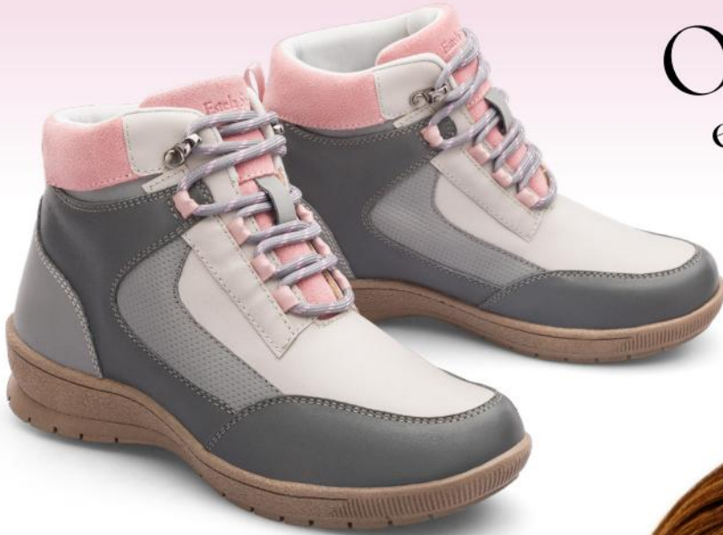
2. Gris claro CUERO LISO + GAMUZÓN