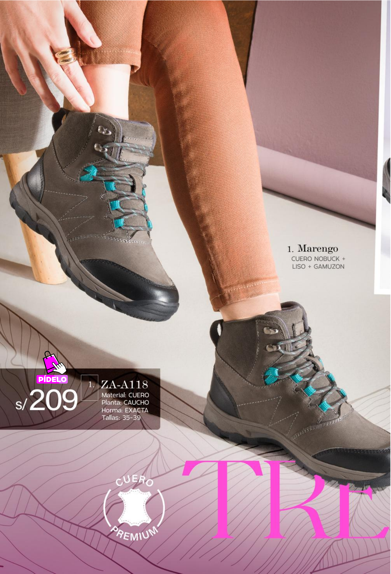
1. Marengo CUERO NOBUCK + LISO + GAMUZON