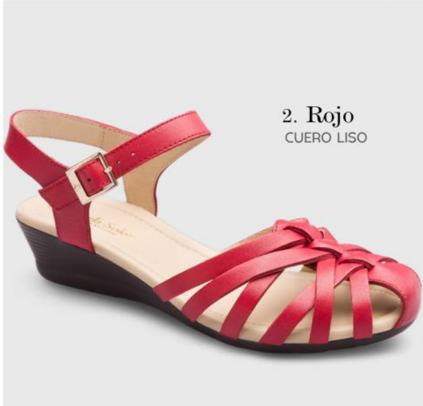
2. Rojo CUERO LISO