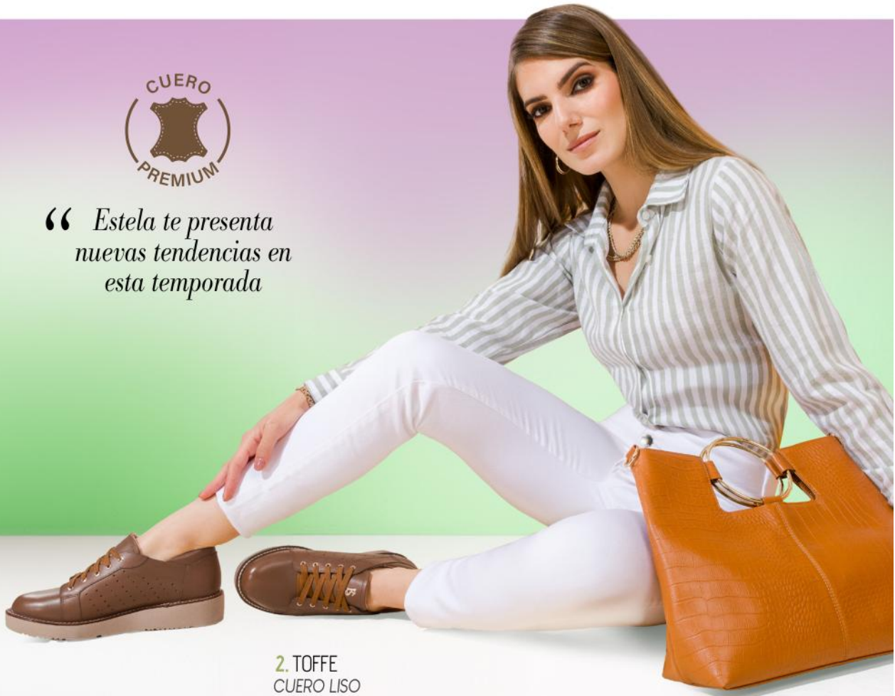
2. TOFFE CUERO LISO

“ Estela te presenta nuevas tendencias en esta temporada