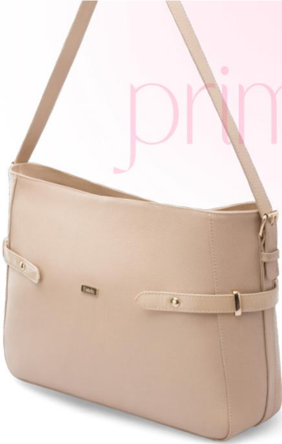
1. AVELLANO CUERO LISO