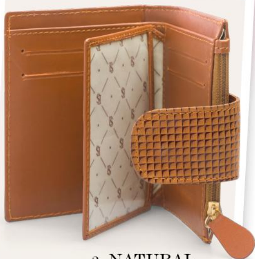
2. NATURAL CUERO LISO + FOLIA