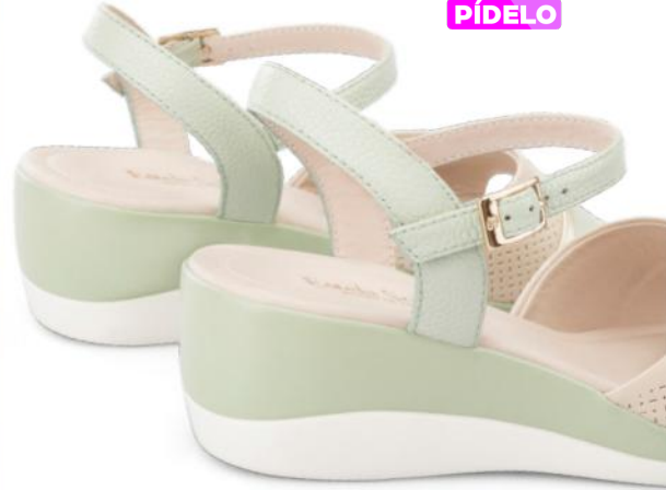
3. VERDE/BEIGE CUERO LISO + METALIZADO