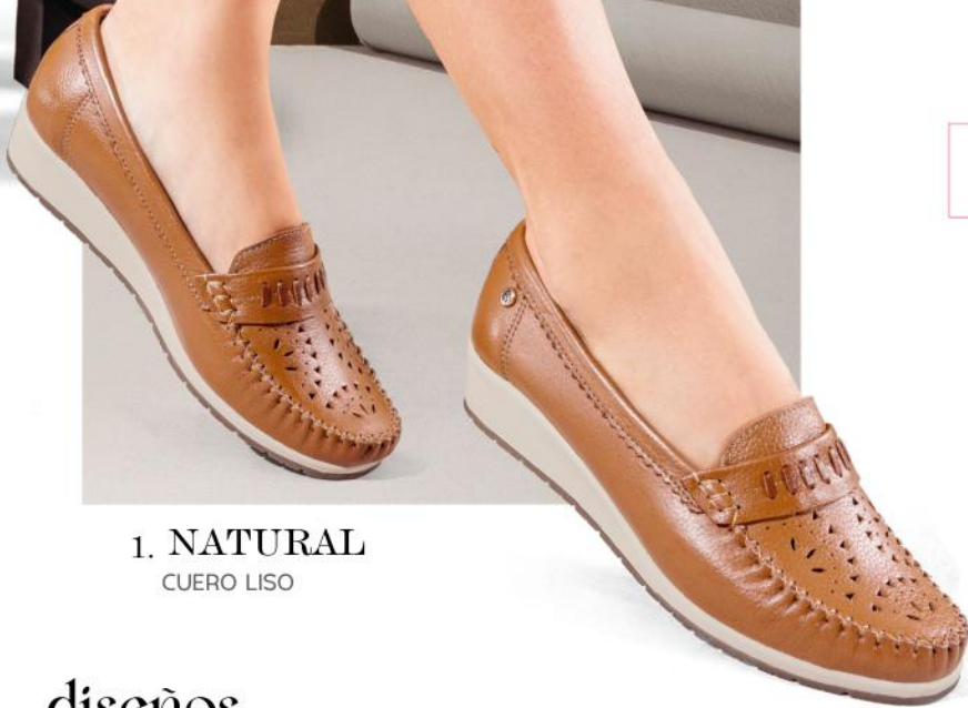
1. NATURAL CUERO LISO