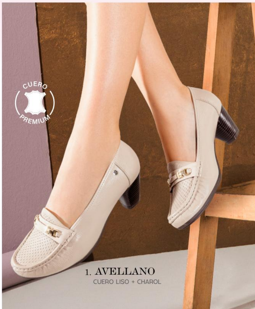
1. AVELLANO CUERO LISO + CHAROL